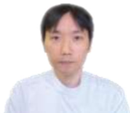
腎臓内科診療部 医長