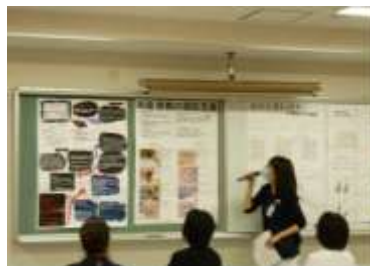
▲活動報告会の様子2