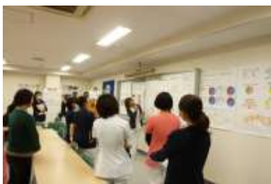
▲活動報告会の様子